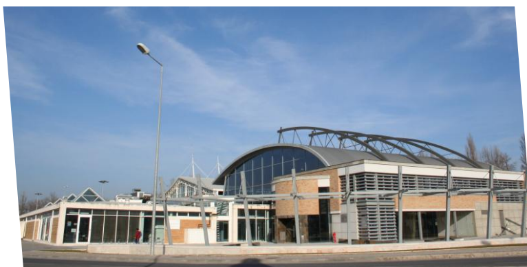
Complexo Municipal de Piscinas de Leiria

A LEIRISPORT, EM irá por em prática outras medidas de responsabilidade social ambiental, ao longo deste ano.